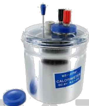
รูปที่ 4.2 แคลอริมิเตอร์แบบง่าย (Calorimeter) [6]

ค่าคงที่แคลอริมิเตอร์ ( C_c ) คือปริมาณความร้อนที่ทำให้อุณหภูมิของแคลอริมิเตอร์สูงขึ้น 1^\circ\text{C} ซึ่งสามารถทำได้โดยนำน้ำร้อนผสมกับน้ำเย็นในแคลอริมิเตอร์ น้ำร้อนจะถ่ายเทความร้อนให้น้ำเย็นและแคลอริมิเตอร์ ถ้าน้ำร้อนมีอุณหภูมิลดลงเท่ากับ \Delta T_1 น้ำเย็นและแคลอริมิเตอร์มีอุณหภูมิสูงขึ้นเท่ากับ \Delta T_2 สามารถคำนวณความร้อนที่สูญหายไปได้ดังนี้ [7]