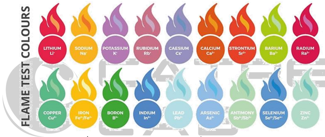
รูปที่ 2.1 ลักษณะสีไอออนของโลหะเมื่อทดสอบด้วยเปลวไฟ [1]

การตรวจดูสีของเปลวไฟ (Flame test) เป็นขั้นตอนที่ใช้ในการทดสอบเชิงคุณภาพ เพื่อระบุไอออนของโลหะบางชนิดในสารประกอบ ซึ่งสารประกอบที่มีไอออนของโลหะชนิดเดียวกันจะมีสีเปลวไฟที่เหมือนกัน และสีของเปลวไฟไม่จำเป็นต้องมีสีเหมือนผลึกของสาร เช่น KCl ที่มีผลึกสีขาว และ \text{KMnO}_4 ที่มีผลึกสีม่วง เมื่อนำมาเผาด้วยเปลวไฟจะได้สีของเปลวไฟที่เกิดจากไอออนของ \text{K}^+ ที่มีสีม่วง [1]